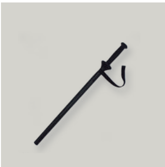
BASTON POLICIAL CORTO COD: AC00062