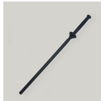
BASTON POLICIAL LARGO COD: AC00063