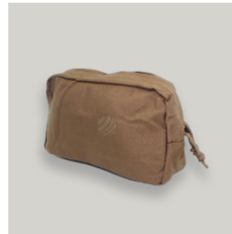
ESTUCHE UTILITARIO TRJ COD: AC00072