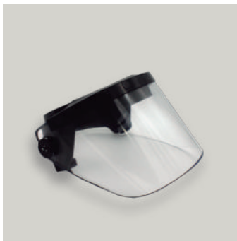
CASCO VISERA BALISTICA COD: AC00065