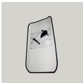
ANTIDISTURBIO STANDARD COD: E00041