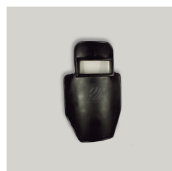
BALISTICO CON VISOR COD: E00044