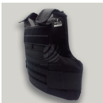
TACTICO TRJ COD: T000