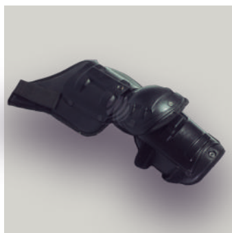
HOMBRERA EQUIPO ANTIDISTURBIO TRJ COD: T00031