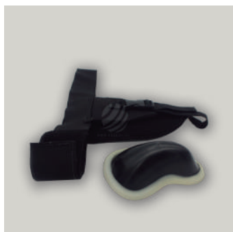
PROTECTOR GENITAL EXTERNO COD: AC00076