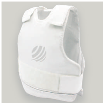
INTERIOR ALX COD: A00011