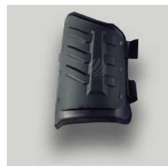
MUSLERA EQUIPO ANTIDISTURBIO TRJ COD: T00031