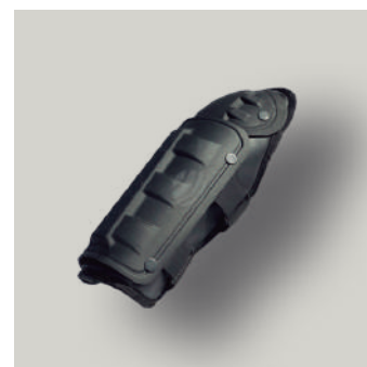
ANTEBRAZO EQUIPO ANTIDISTURBIO TRJ COD: T00031