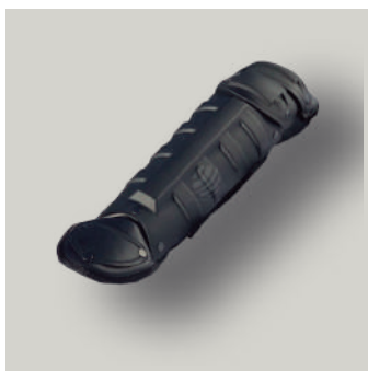
CANILLERA EQUIPO ANTIDISTURBIO TRJ COD: T00031