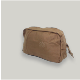
ESTUCHE UTILITARIO TRJ COD: AC00072