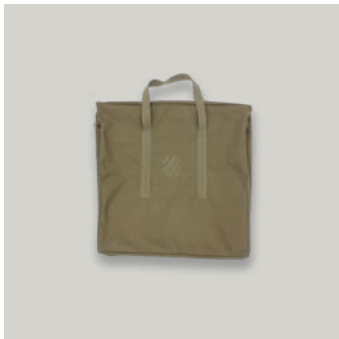
BOLSO PARA CHALECO COD: AC00075