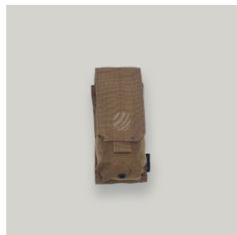
PORTA CARGADOR SIMPLE FUSIL (M4/M16) TRJ COD: AC00070