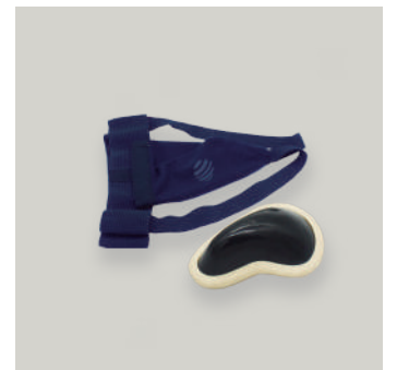
PROTECTOR GENITAL INTERNO COD: AC00067