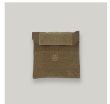
ESTUCHE ADMINISTRATIVO TRJ COD: AC00074