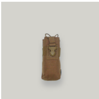
PORTA RADIO TRJ COD: AC00068