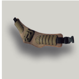
CINTURON ANTIDISTURBIO TRJ COD: AC00064