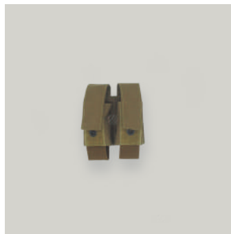
PORTA CARGADOR DOBLE PISTOLA (9MM)TRJ COD: AC00069