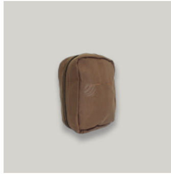
ESTUCHE MEDICO TRJ COD: AC00073