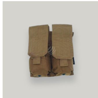
PORTA CARGADOR DOBLE FUSIL (M4/M16) TRJ COD: AC00071